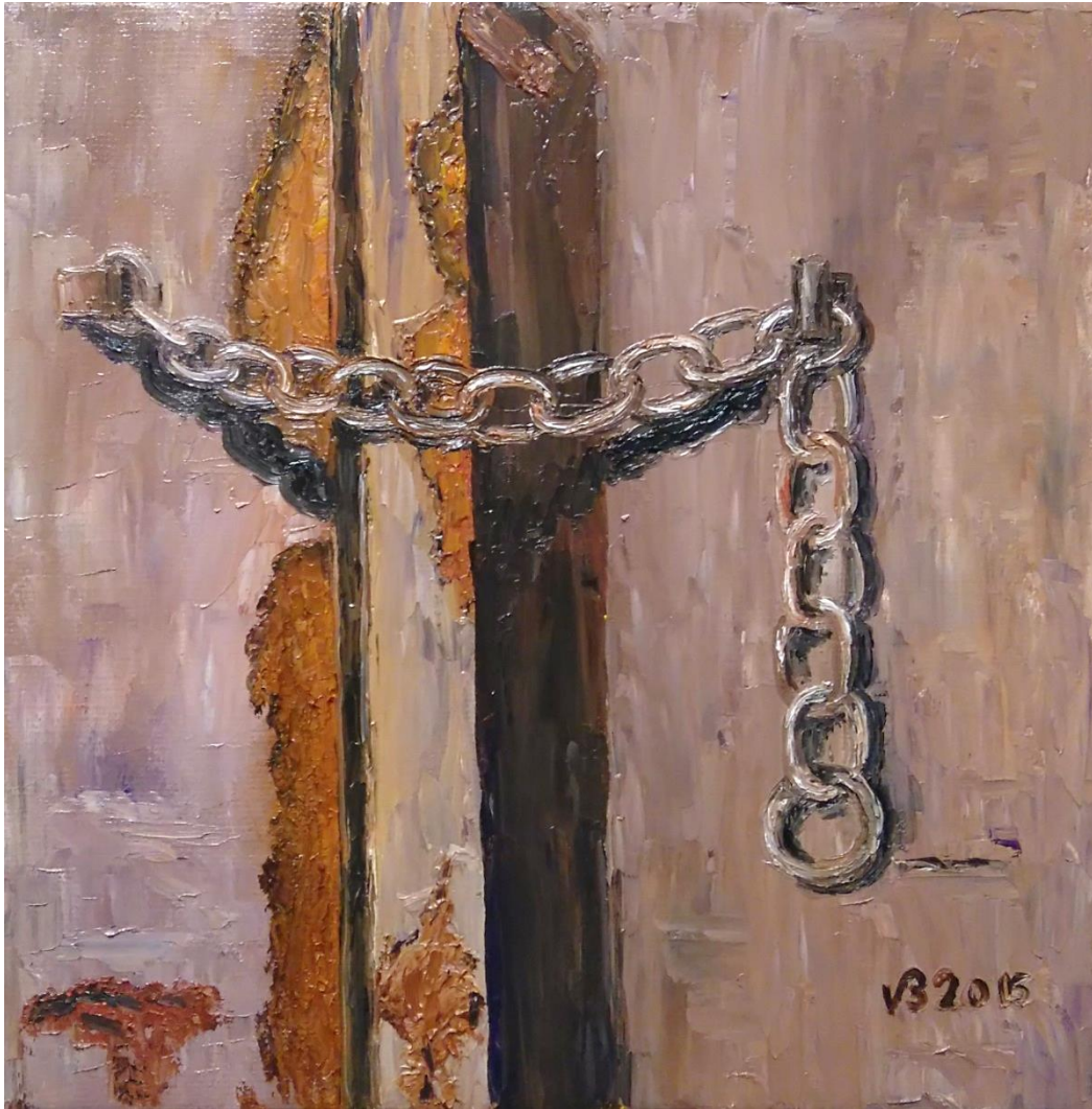
Altes Eisen I | Öl 2015 | 30 x 30 cm