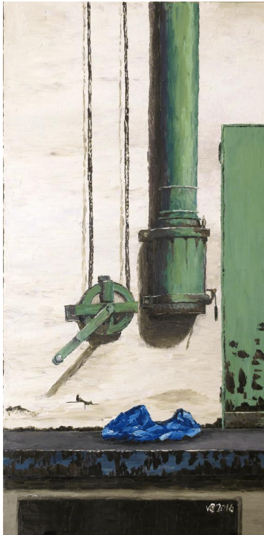
Altes Eisen 11 | Öl 2016 | 50 x 100 cm