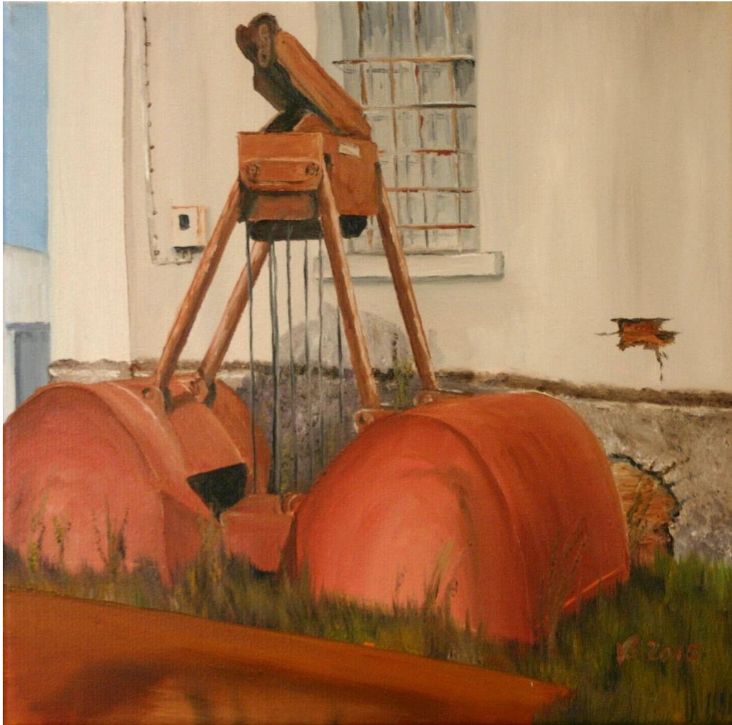
Lindener Hafen III | Öl 2015 | 30 x 30 cm