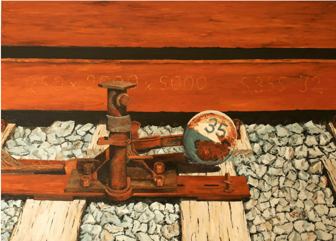
Altes Eisen 10 | Öl 2016 | 140 x 100 cm