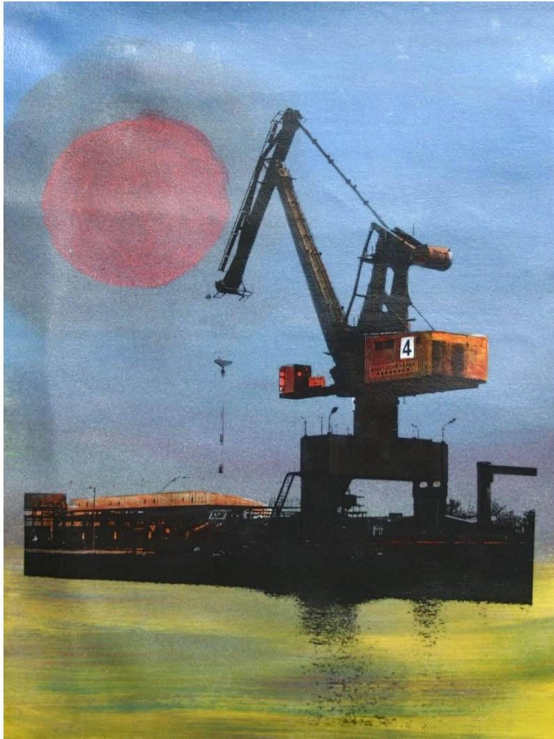
Ladekran | Acryltransfer 2012 | ca. 28 x 38 cm