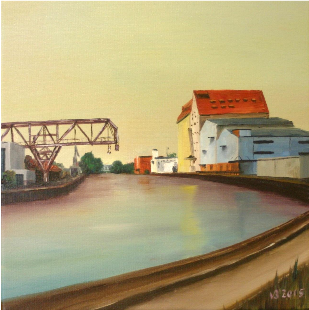
Lindener Hafen I | Öl 2015 | 30 x 30 cm