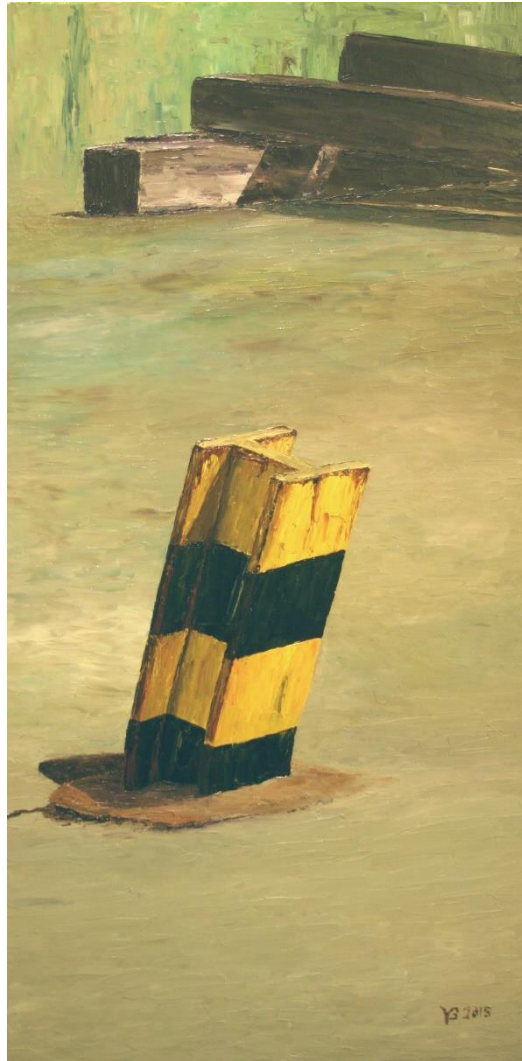
Lindener Hafen 5 | Öl 2015 | 50 x 100 cm