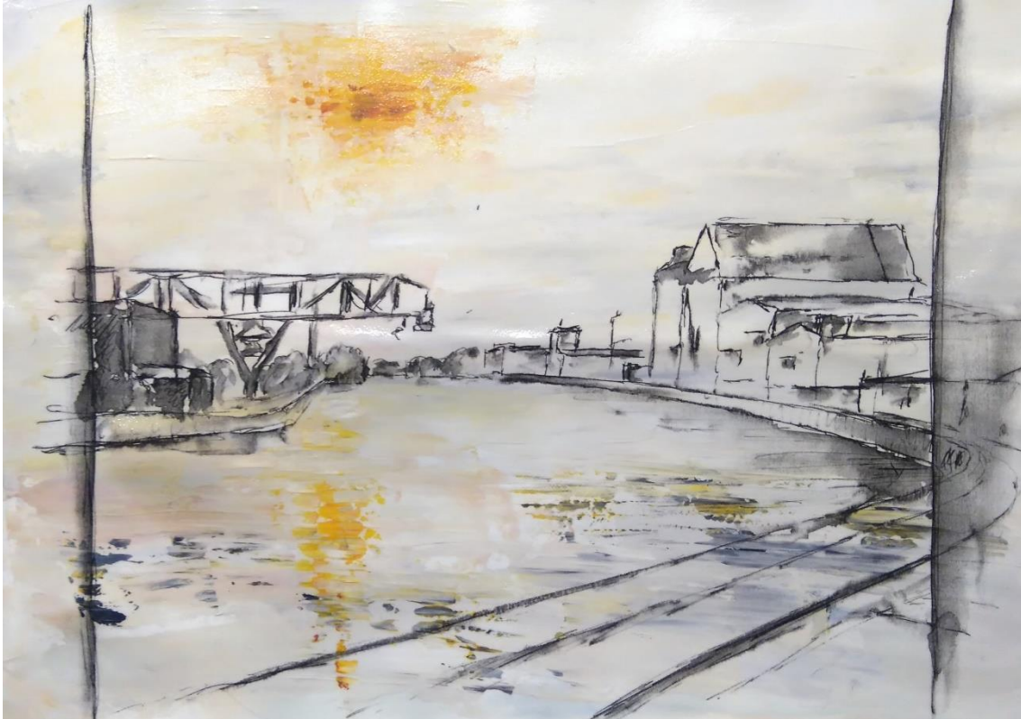
Hafenpanorama | Acryltransfer 2017 | ca. 38 x 28 cm