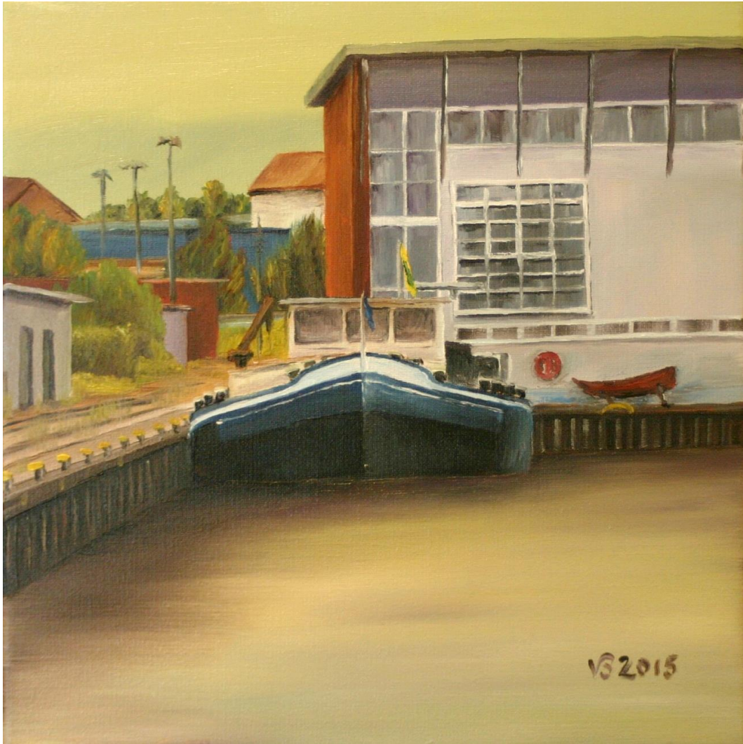
Lindener Hafen II | Öl 2015 | 30 x 30 cm