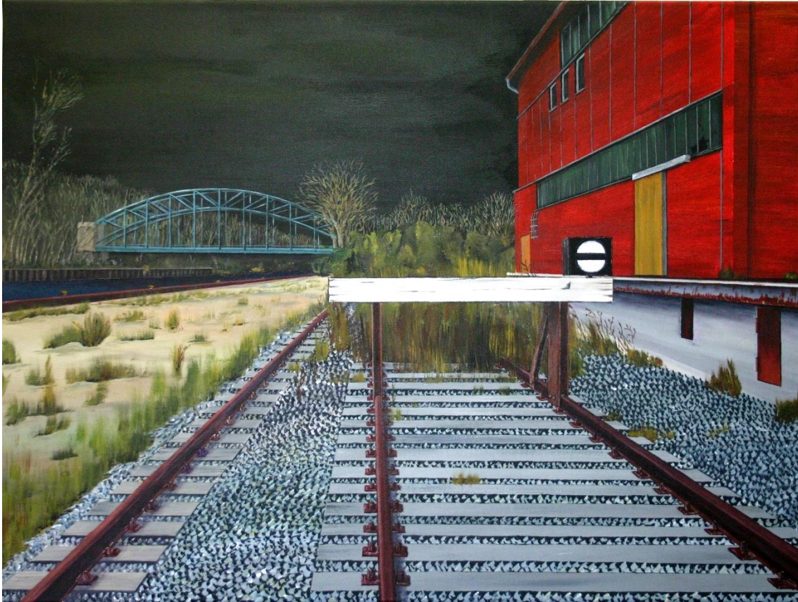
Das Lindener Tor zur Welt | Acryl 2014 | 70 x 100 cm