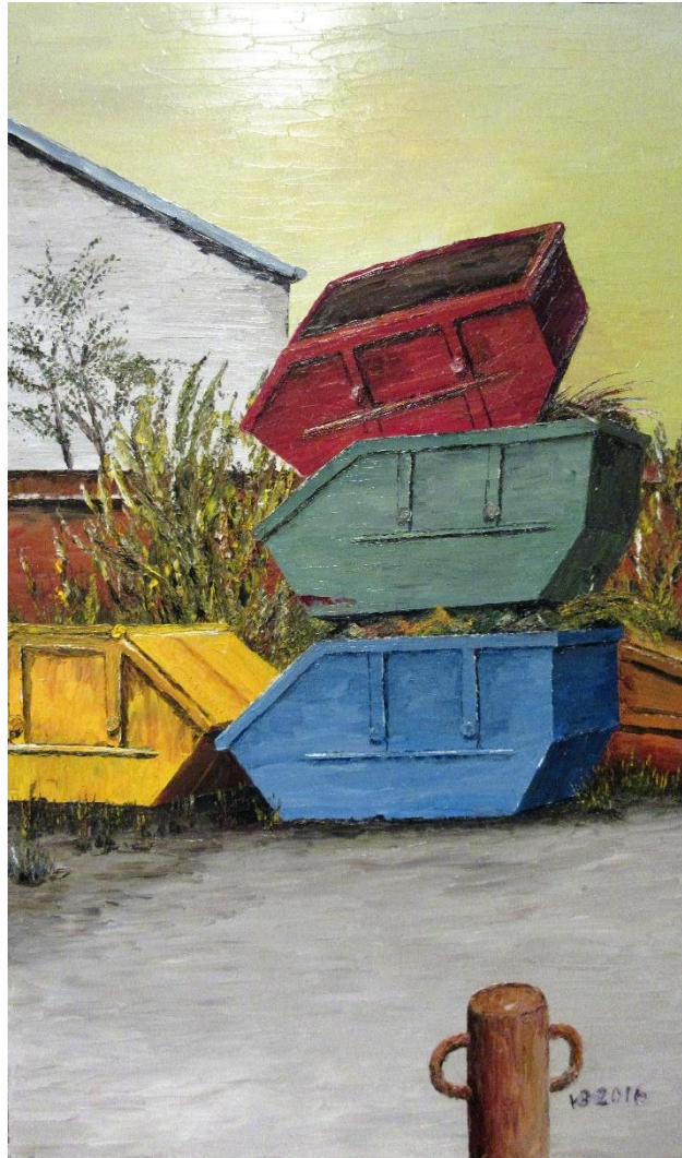
Beim Schrotthändler | Öl 2016 | 60 x 100 cm