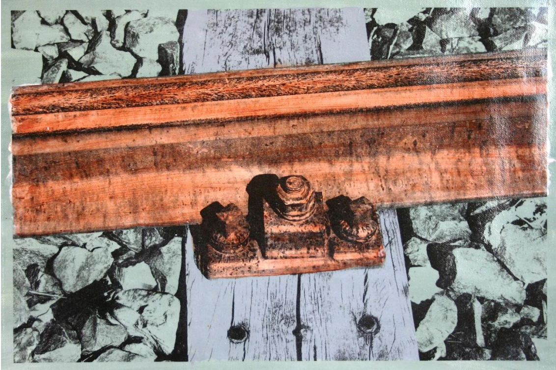
Hafenbahnschiene | Acryltransfer 2013 | ca. 38 x 28 cm