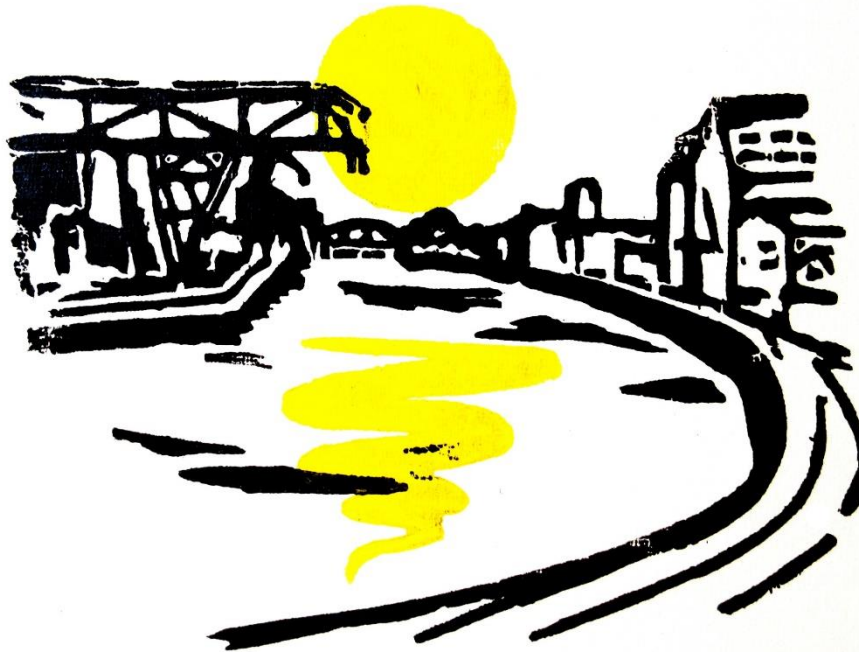
Hafenpanorama | Holzschnitt 2016 | ca. 18 x 24 cm