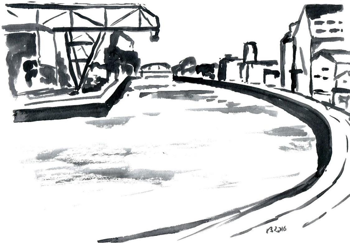
Hafenpanorama | Aquarell 2016 | ca. 15 x 20 cm